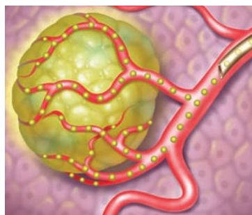
Tumores hepáticos tratados con microesferas SIR-Spheres

Las microesferas SIR-Spheres están aprobadas para el tratamiento de tumores hepáticos que no pueden extraerse mediante cirugía. Estos pueden ser tumores que comienzan a